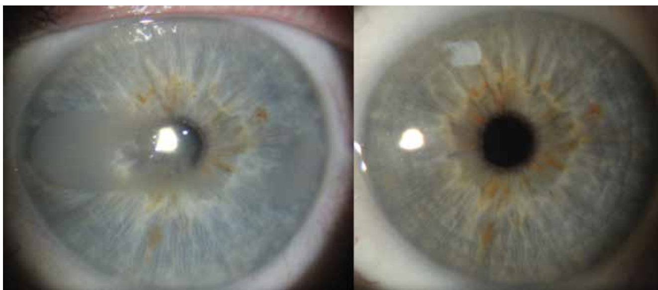
Obrázek 2. Vlevo předoperační nález pacienta č. 1, vpravo kompletní remise – 3 roky po operaci

U všech žen se jednalo o unilaterální onemocnění. U jediného muže bylo postižení oboustranné, nicméně léčeno bylo pouze symptomatické levé (nedominantní) oko. Bilaterální poškození rohovky u tohoto nemocného bylo zřejmě v souvislosti s dlouhodobou lokální aplikací anti-