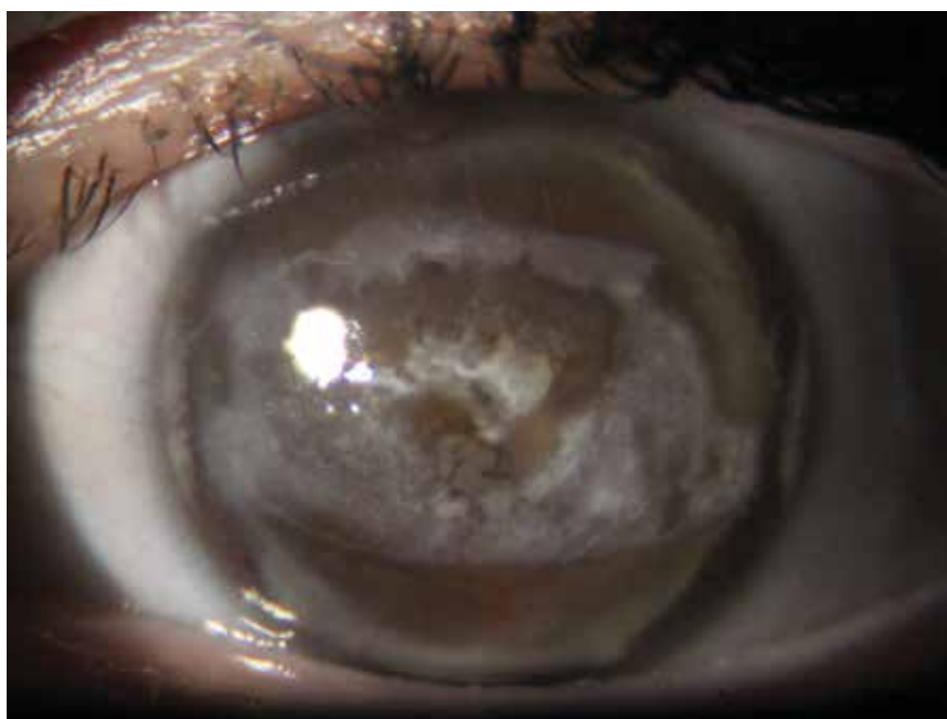
Obrázek 1. Zonulární keratopatie pacientky č. 4

Retrospektivně byly vyhodnoceny dlouhodobé výsledky terapie pacientů se zonulární keratopatií, kteří byli lé-