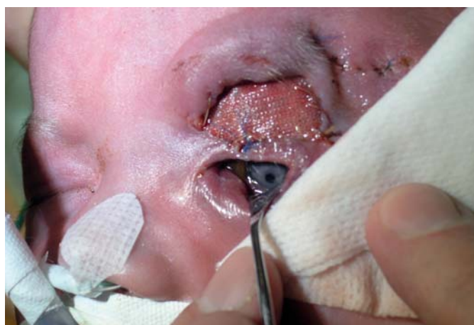
Obr. 5. Stav 2. den po operaci.

Proto jsme nasadili adekvátní terapii pro hemangiom – perorální léčba propranololem a kortikoidy. Pro progresi útvaru byl aplikován DepoMedrol 40 mg inj. do útvaru, 3 bolusy SoluMedrolu i.v. a byla zahájena salvage terapie pro děti s rychle progredujícími hemangiomy (1x Avastin, 1x Taxol i.v.)