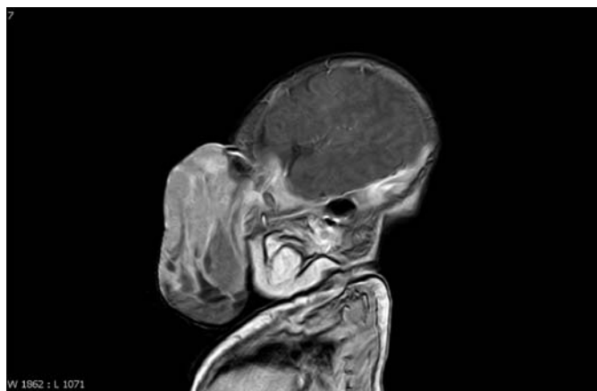
Obr. 11. MR mozku – 29. den po narození.