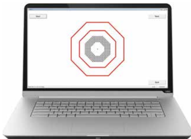
Obrázek 1. Testové rozhraní při testování metamorfopsií v programu D Chart

Kvantifikace metamorfopsie tedy může pomoci zhodnotit zlepšení zrakových funkcí pacienta a pomoci vybrat vhodného pacienta pro operaci. To vedlo autory k vývoji testu nazvaného D Chart, který je možné použít před operací i po operaci u pacientů s nízkou zrakovou ostrostí pro kvantitativní zhodnocení jejich metamorfopsie [7]. V původním provedení byl test v podobě papírových kartiček. Na kartičkách byly vytištěné prstence tvořené malými testovými čtverci kolem centrální fixační značky. Prstence měly různý poloměr. Vzdálenost jednotlivých čtverců rozmístěných do pravidelné mřížky byla od 0,4^\circ do 1,8^\circ . Pacient měl za úkol v každém z celkem osmi sektorů prstence označit místo, kde se mu mřížka zdála pokřivená. Suma maximální vzdálenosti mezi čtverci z každého sektoru a pro každou velikost prstence, při které viděl pacient mřížku ještě pokřivenou, tvoří celkové skóre metamorfopsie (M-skóre). V pilotní studii [7] byl prokázán pokles mediánu celkového M-skóre u pacientů před operací a po operaci