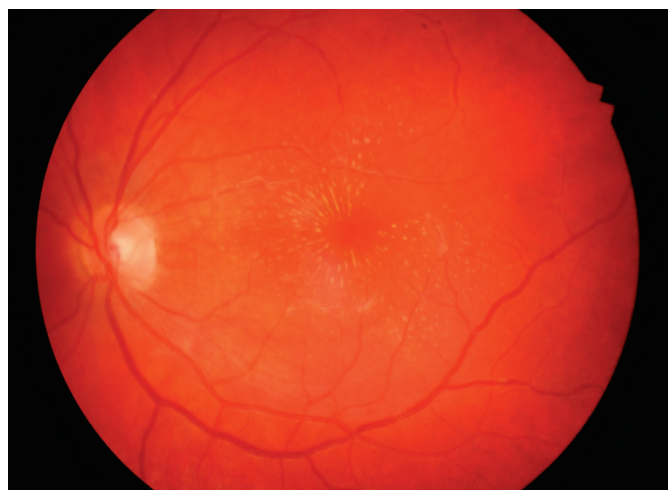
Obr. 2. Vstupní nález hvězdicové makulopatie levého oka