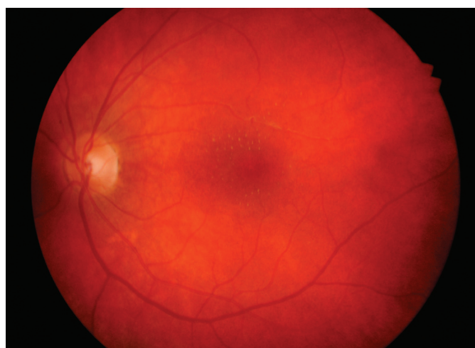
Obr. 4. Hvězdicová makulopatie levého oka měsíc po léčbě