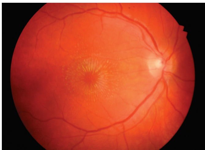
Obr. 1. Vstupní nález hvězdicové makulopatie pravého oka