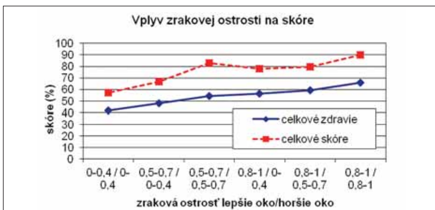
Graf 3. NKZO vs. VFQ-25

hypertenznej choroby bol rovnaký v skupine DME (74 %) a VPDM (72 %). V kontrolnej skupine trpí týmto ochorením iba 52 % jedincov, čo možno pripísať na vrub mladšiemu veku skupiny.