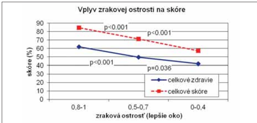
Graf 2. NKZO vs. VFQ-25

95% interval spoľahlivosti je vytvorený ako skóre ± 95% CI p-hodnoty sú výsledkom t-testu v porovnaní s kontrolnou skupinou