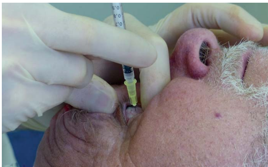
Obr. 1 Technika intravitreální aplikace

V prvním období (roky 2005–2011) – při ATB profylaxi dle SPC jsme aplikovali celkem 2651 injekcí (1087 x Macugen, 1092 x Lucentis, 101 x TMC, 371 x Avastin) (tab. 1). V tomto období byly evidovány dva případy endoftalmitidy (oba po