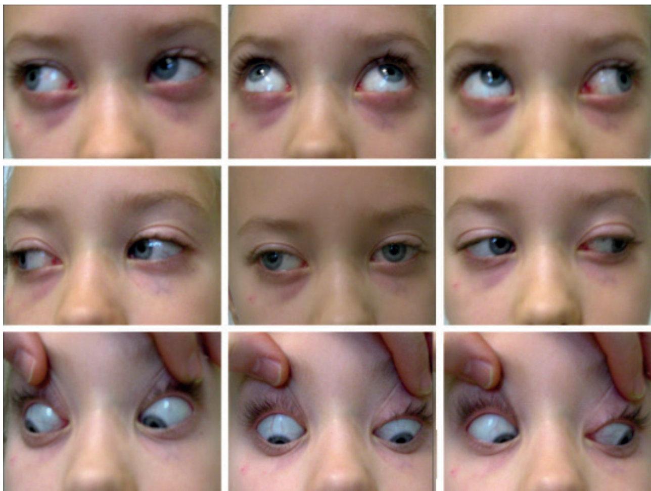
Obr. 4 Osmiletá pacientka – rozbor motility ve všech pohledových směrech u strabismu sursoabductorius