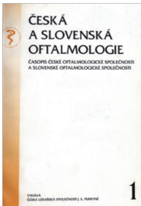
Obrázek 10. Česká a slovenská oftalmologie 1995;51(únor)

29. 4. 1949 se sešel výbor společnosti [17], Kurz informoval o nové situaci, která vznikla reorganizací Spolku českých lékařů. Byly probrány navrhované stanovy a k jednotlivým bodům sděleny připomínky. Jelikož nové stanovy Spolku lékařů českých až dosud nebyly schváleny, bylo doporučeno jednotlivým společnostem, aby zatím neměnily svoji vnitřní strukturu, což však později bude nutné. Počet členů společnosti v roce 1949 (k 6. září) je 204 (Čechy 117, Morava 47, Slovensko 40).