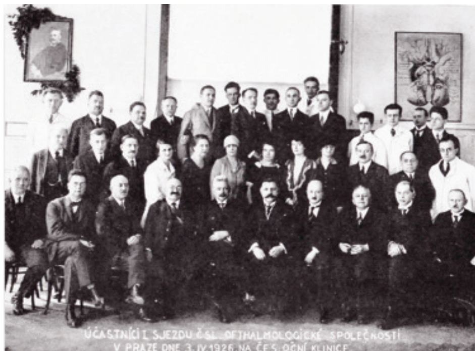
Obrázek 3. Účastníci sjezdu Čsl. Oftalmologické společnosti v Praze dne 3.4.1926 na české Oční klinice [7]

až do roku 1938, kdy se koncem června konal XIII. Sjezd společnosti v Praze, již v dusném prostředí napjaté mezinárodní situace. Jak se potom drobilo území našeho státu, život se před očima rozplýval a zbyla nás jen malá hrstka, vzrůstalo mlčení i ve strádajících pracovnách.“